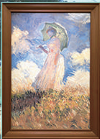
クロード・モネ「散歩、日傘をさす女」

わたしたちゲイルは、大阪京町堀を拠点とした企画・デザイン・編集会社 スタッフによる日常を綴ったブログマガジン「藝風日和」をご紹介します