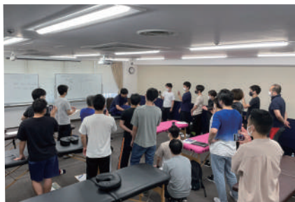
全国各地で研修会を実施

他では例を見ない卓越した理学療法理論に基づく施術で多くの患者様を身体的苦痛から解放されてきており、様々な広報手法での指導も行っておられます。