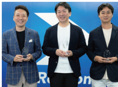
ダイレクト出版 マーケティングコンテスト最優秀賞を受賞

私たち、Physio Lab.の理学療法士や柔道整復師、鍼灸師などの治療技術者に向けたセミナー事業と店舗での施術を行なっています。